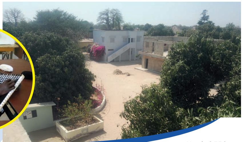
Vue du C.F.F.O.

La SARL a un rôle important à jouer pour aider les jeunes à trouver un emploi en leur faisant acquérir une première expérience professionnelle. Elle a aussi pour mission d'aider au financement du Centre de Formation.