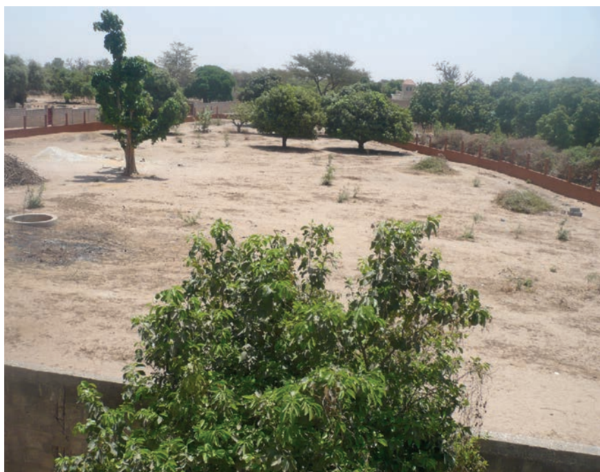
Le terrain déjà clos de murs du futur Foyer-Logement