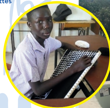
Elève en classe de couture

Nous sommes en mesure d'organiser votre voyage et de vous faire découvrir notre Centre bien sûr mais aussi différentes facettes de ce beau pays qu'est le Sénégal.