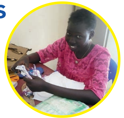
Elève en classe de couture